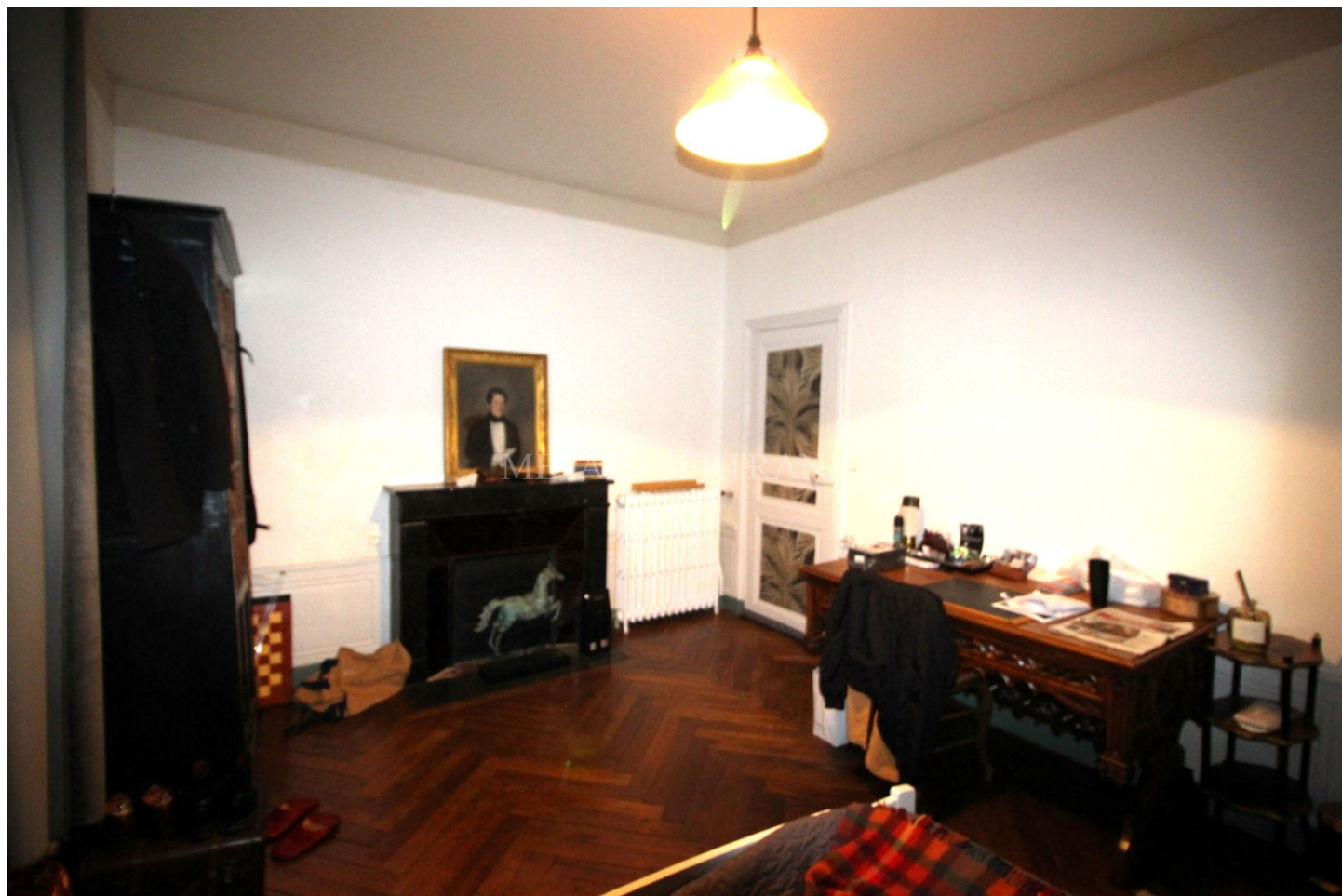
Chambre 2 de 18 m 2 (lambris bas, cheminée) Salle de bains. W.C.