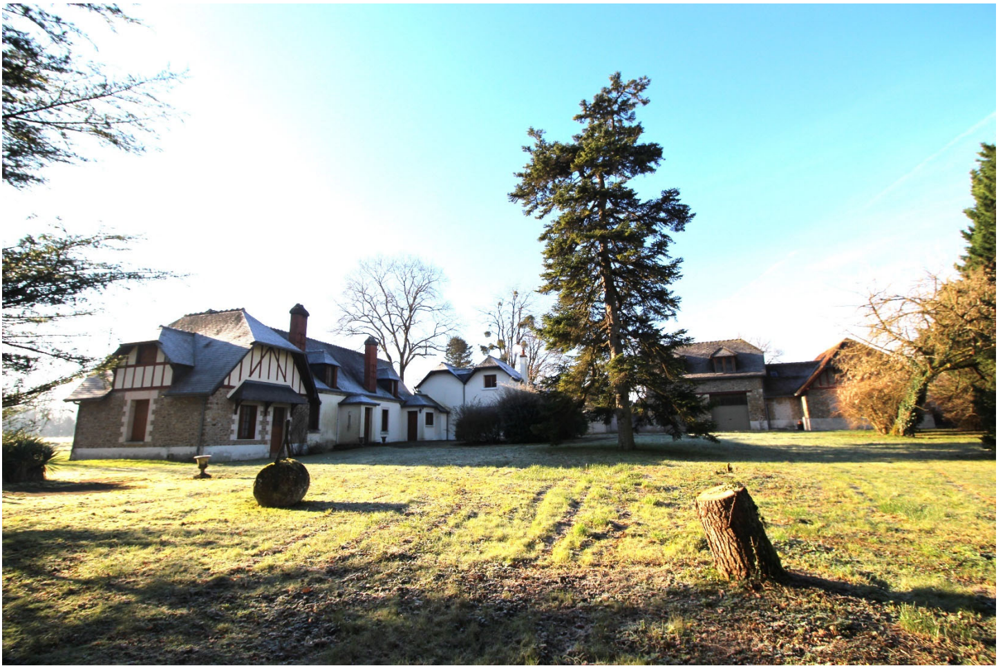
L'HABITATION PRINCIPALE : surface habitable de 225 m 2 (surface au sol de 268 m 2 )